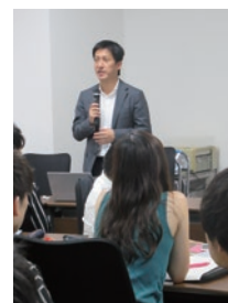
戦略コンサルタントの講義の様子